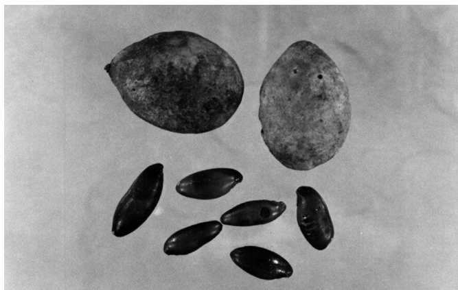
Figura 1. Frutos e sementes de baru ( Dipteryx alata Vog.).

Os tocoferóis foram separados e quantificados por cromatografia líquida de alta eficiência – CLAE, conforme